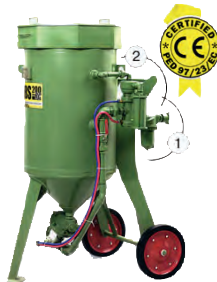
Sabbiatrici con comando pneumatico Sandblasting with pneumatic control