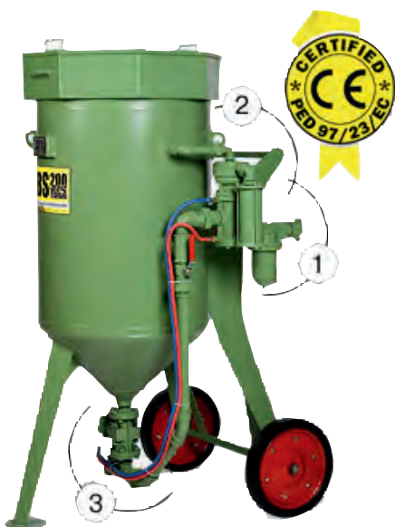
Sabbiatrici con comando pneumatico e valvola miscelazione Sandblasting with pneumatic control and mixing valve