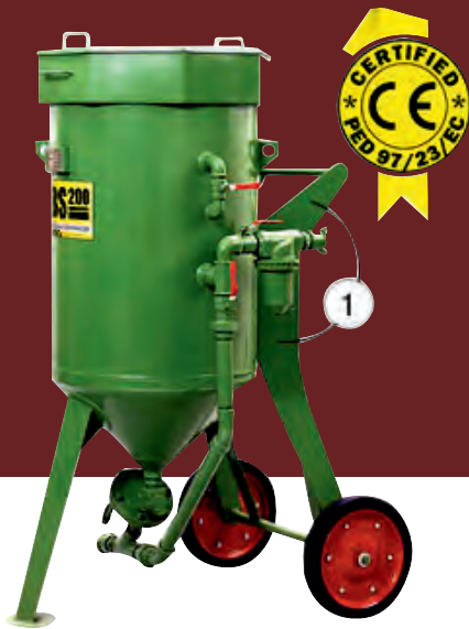
Sabbiatrici con comando manuale Sandblasting with manual control

Constant commitment and the continuous search for innovative products is our response to your needs.