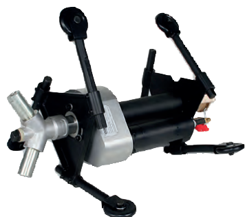
Sistema di sabbatura interna tubi da 12"(300 mm) a 36"(900 mm) Internal pipe blast tool 12"(300 mm) a 36"(900 mm)